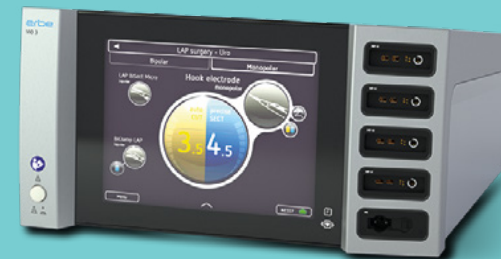
Elektrokirurgisk enhet VIO® 3 – anslut och använd